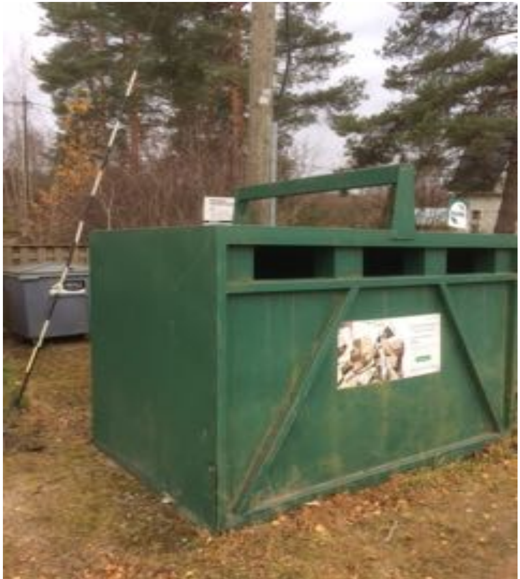
Kuva 8. Hyötis Mankalassa ratatiellä

Ympäristöltään alue on entistä pienviljelijöiden maaseutualuetta, joka on muodostunut ja kehittynyt osittain Kaukas Oy Ab:n lankarullatehtaan aktivoimana. Kurrin kartanon maiden ositus sekä Mankalan sijainti radan ja valtatie välissä, ja myös Kymijoen läheisyys on antanut leimansa ympäristön ja luonnon maantieteelliselle kehitykselle. Metsän osuus alueesta on merkittävä.