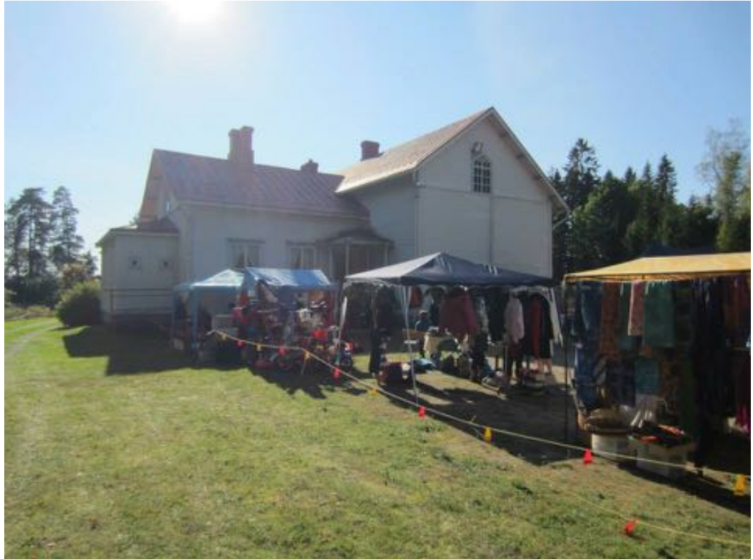
Kuva 9. Toimintakeskus Einola

Kaukaan kyläyhdistyksen ja kyläläisten oma kokoontumispaikka on toimintakeskus Einola. Einola sijaitsee yksityisessä omistuksessa olevan entisen Kaukaan koulun vanhemman koulurakennuksen tiloissa, jotka Iitin kunta on vuokrannut kyläyhdistyksen käyttöön. Toimintakaudella 2016 Einolassa toimii noin kerran kuukaudessa kokoontuen kyläyhdistyksen ylläpitämä Lasten kerho, samoin kerran kuussa järjestettävät hierontailat. Iitin Kunnan Vapaa-aikapalveluiden tarjoama jumppa on maanantaisin, ja Iitin Kansalaisopiston jumppalaiset kokoontuvat keskiviikkoisin. Einola on myös vuokrattavissa kaikille kyläläisille juhla- ja kokouskäyttöön.