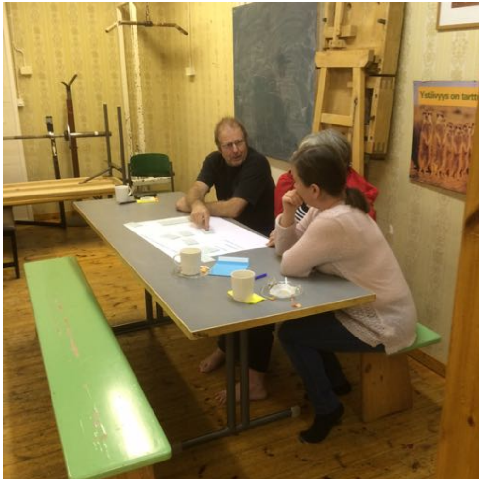
Kuva 12. Ideailan työskentelyryhmä touhussa

Vaikka kyläkyselyssä ja ideailloissa sekä videohaastatteluissa esille tulleet kehittämistarpeet, -ideat ja -toimenpiteet ovat osittain samansuuntaisia, ovat ne tässä kyläsuunnitelmassa esiteltynä ja koottuina jokainen omaan osioonsa niin kuin ne tulivat ilmi.