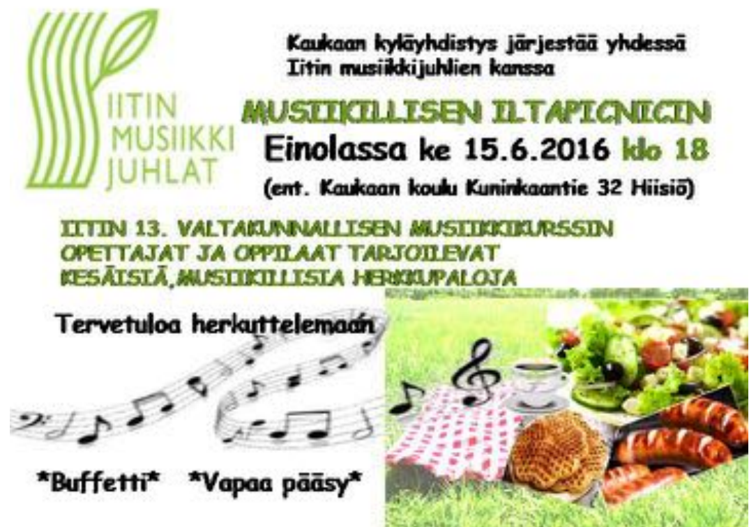
Kuva 10. Musiikillisen Iltapicnicin mainos

Viime vuosina Kaukaan kyläyhdistys on järjestänyt monenlaisia tapahtumia ja toimintaa. Eniten osanottajia keränneistä tapahtumista mainittakoon suuren suosion saavuttanut Syyssäpinät syksyllä 2015, jokavuotiset pikkujoulut sekä ensimmäistä kertaa litin Musiikkijuhlien kanssa yhteistyössä toteutettu Musiikillinen Iltapicnic kesäkuussa 2016. Yhdistys järjestää säännöllisesti myös myyjäisiä ja kirpputoritapahtumia huutokauppoineen.