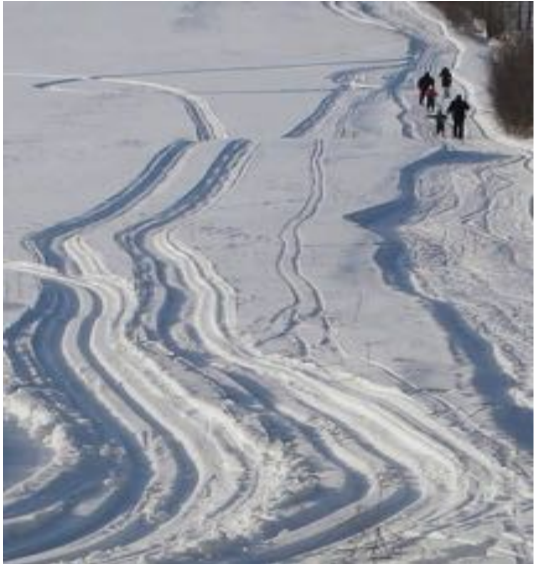
Kuva 11. Hiisiö-Kurri -hiihtolatu

Kaukaalla pidettiin hiihtokilpailuja tehtaan työläisten toimesta jo koko tehtaan olemassaolon ajan. Kaukaan kylätoimikunta järjesti monia vuosia yhteisiä hiihtotapahtumia nimellä Kaukaan kymppi. Niin kauan kuin Kaukaan koulu oli toiminnassa, Kaukaan kymppi oli suosittu hiihtotapahtuma. Sitten hiihtoladun ylläpito lopahti, aikaa omaehtoiseen talkootoimintaan ei löytynyt, eikä monien vähälumisten talvien sarja edesauttanut hiihtoladun ylläpitämistä.