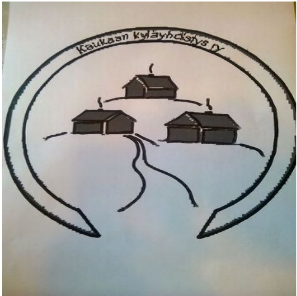
Kuva 3. Kaukaan kyläyhdistyksen logo