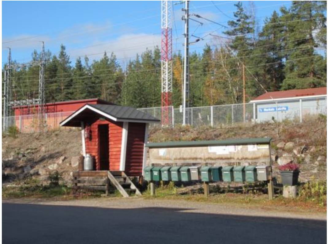
Kuva 1. Mankalan maitolaituri