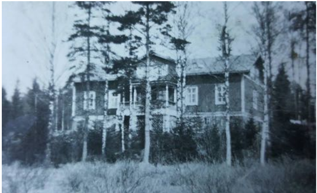
Kuva 5. Kurrin kartano