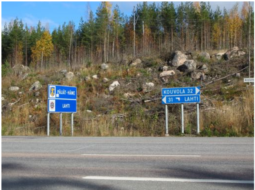
Kuva 2. Valtatienristeys maakunnan rajalla