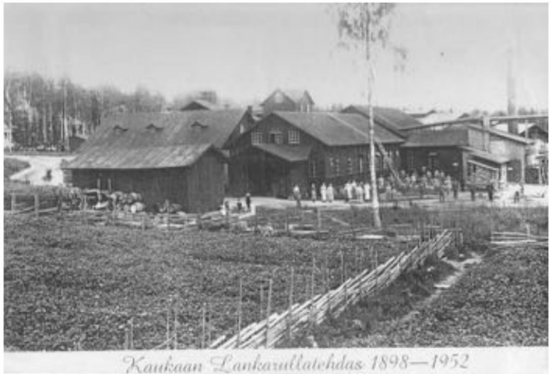
Kuva 6. Kaukaan lankarullatehdas

Vuosina 1897–98 rakennettiin seudulle Suomen kahdeksas lankarullatehdas. Kaukaan Tehdas Osakeyhtiö Mäntsälästä solmi Uudenkylän kartanon omistajattaren sekä Perheniemen Maatila Osakeyhtiön kanssa sopimuksen, jonka mukaan se vuokrasi alueen metsät viideksitoista vuodeksi lankarullateollisuuden käyttöön. Paikalle rakennettiin paitsi tehdaskiinteistöjä ja varastoja, myös työväestön asuintaloja. Tehtaan koneet ja työntekijät siirrettiin Mäntsälästä littiin, Säaskjärven kylän alueelle (Jurkkolan numeroa) Hiisiöön (Halila 1966, 303–306; Tahvanainen ym. 1998, 18–19). Hiisiön nimi juontuu tilasta nimeltä Hiisiöinen, joka on kylän vanhimpia tiloja ja sijaitsee Kaukaan entiseltä tehtaalta noin kilometrin itään Perheniemen suuntaan. Hiisiöllä on oma postinumero, ja kylää sanotaankin osittain Hiisiön kyläksi.